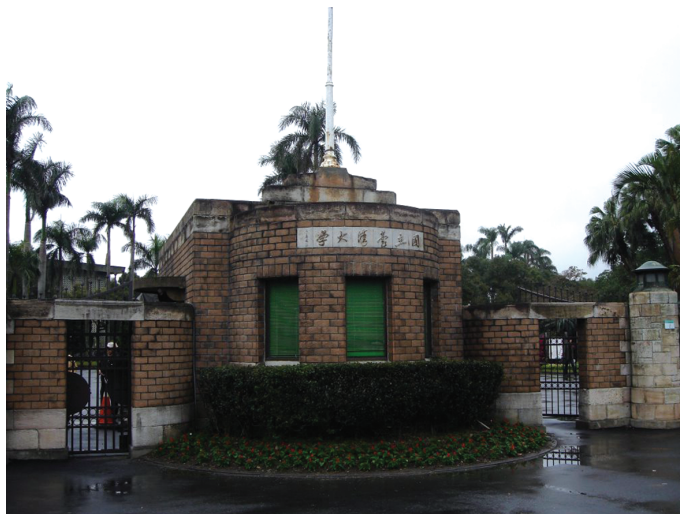
写真 2 写真 1 とほぼ同じ方位で写した写真