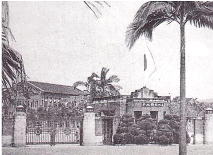
写真 1 台北帝国大学時代の校門