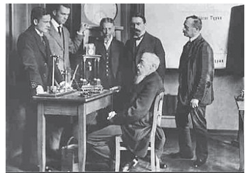
図3 ライプツィヒ大の心理学実験室 https://en.wikipedia.org/wiki/Wilhelm_Wundt