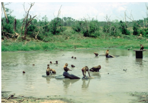
図1 テキサスのサルのフィールドで

本当のことだから言ってしまうと、心理学者に大学のポストがふんだんにあるわけではない。特に、動物を対象とする心理学者は、研究にお金もかかるし、分野も限られる。もともとサルから足を洗おうとは思ってはいたが、それでも