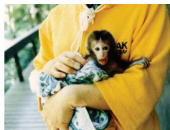
図3 私のやんちゃ娘